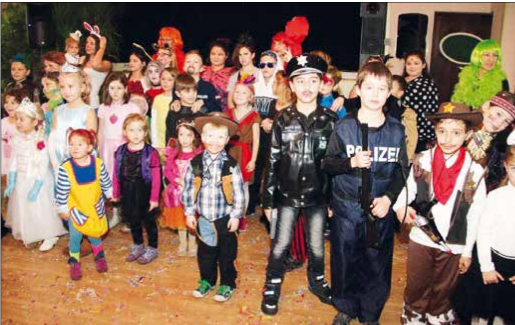
Großen Andrang gab es auch heuer wieder beim Kinderfasching in Etsdorf, bestens organisiert von der Frauenbewegung. Fantasievoll maskiert, unterhielten sich die Kinder bei Musik und Spielen bestens.